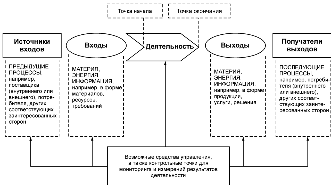
Рисунок 1 — Схематичное изображение элементов процесса

Рисунок 1 дает схематичное изображение любого процесса и иллюстрирует взаимосвязь элементов процесса. Контрольные точки мониторинга и измерения, необходимые для управления, являются специфическими для каждого процесса и будут варьироваться в зависимости от соответствующих рисков.