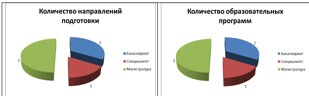
Рисунок 1 - Распределение реализуемых направлений подготовки и специальностей по уровням высшего образования

Контингент обучающихся на 01.10.2019 в целом по филиалу, составлял – 49 человек, в том числе по очной форме обучения – 42, по заочной – 7.